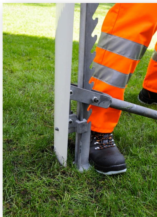
4. Зафиксировать демонтажный инструмент ногой и извлечь СТИЛ ФЛЕКС из грунта с помощью рычага