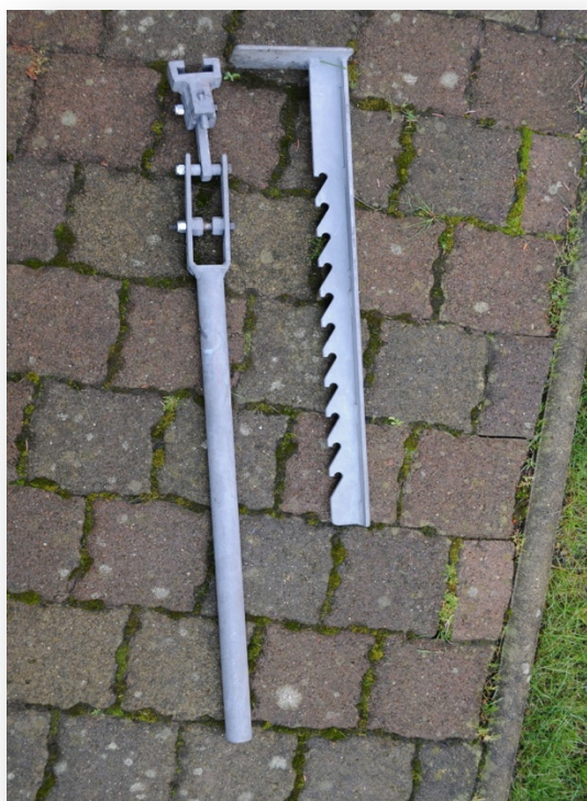
1. Специальный, особо прочный инструмент для демонтажа из оцинкованной стали, состоящий из двух частей