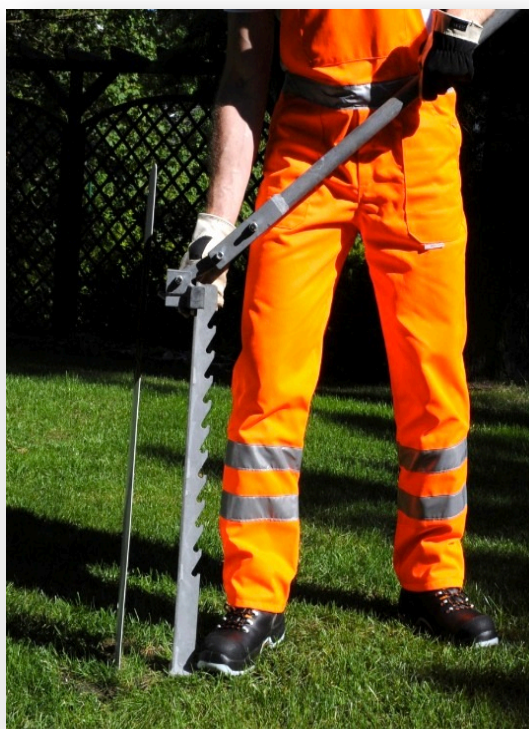
2. Собрать инструмент, соединив обе части